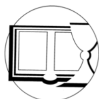
Českobratrská církev evangelická